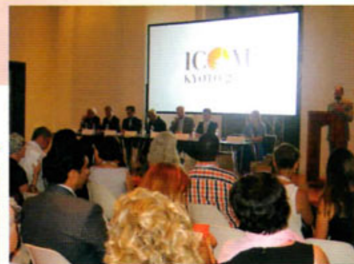
▲国際博物館会議(ICOM)大会は、世界中の博物館の専門家が参加する大変貴重な大会